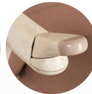
control de movimiento