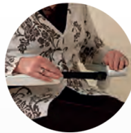
cinturón de seguridad