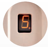
pantalla de diagnóstico