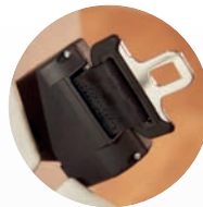
cinturón de seguridad