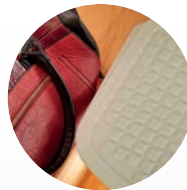
sensor de obstáculos